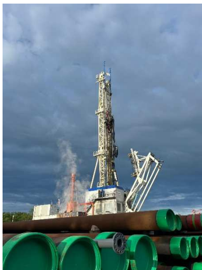
Erfolgreicher Pumpstest in Polling bei Mühldorf im Mai 2024

- Eine Anmeldung für die Teilnahme an dem Abend ist nicht erforderlich -